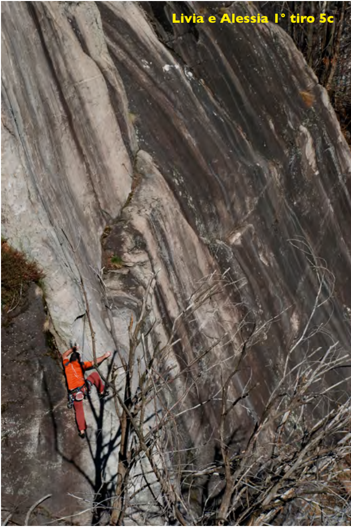
Livia e Alessia 1° tiro 5c